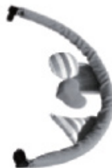
ARCHE DE JOUETS