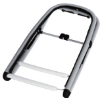
CADRE EN ALUMINUM

Lire attentivement la notice avant utilisation et la conserver pour consultation. L'enfant risque de se blesser si vous ne suivez pas ces instructions.